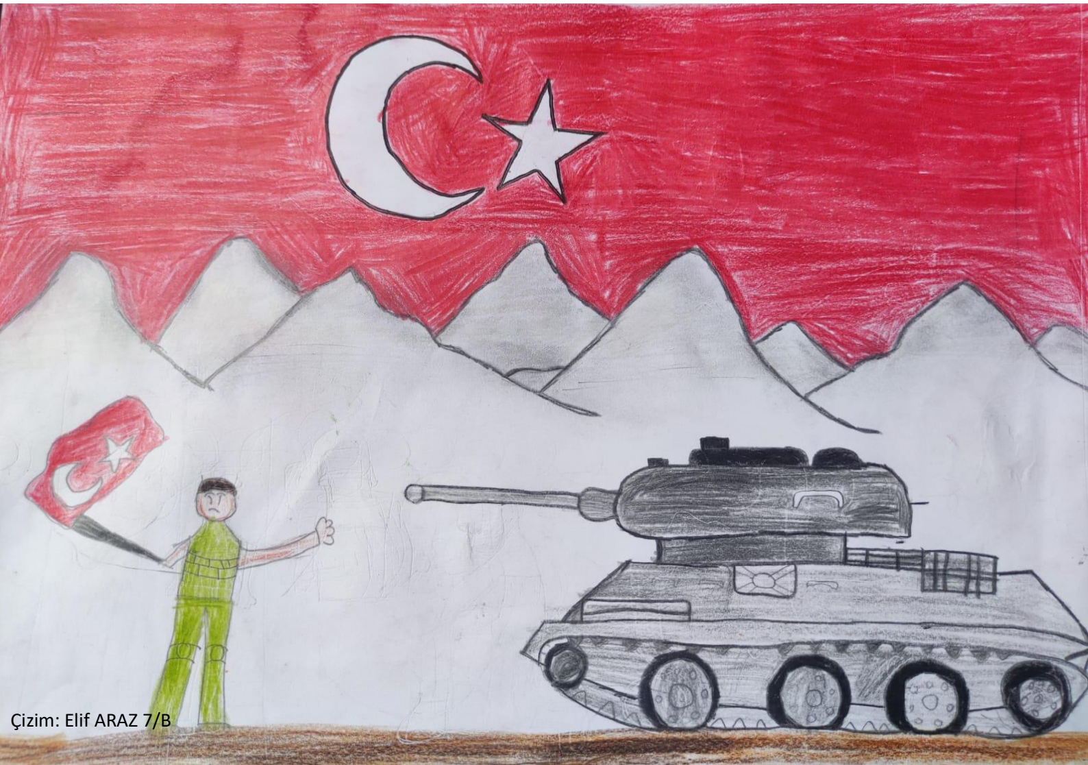
Çizim: Elif ARAZ 7/B